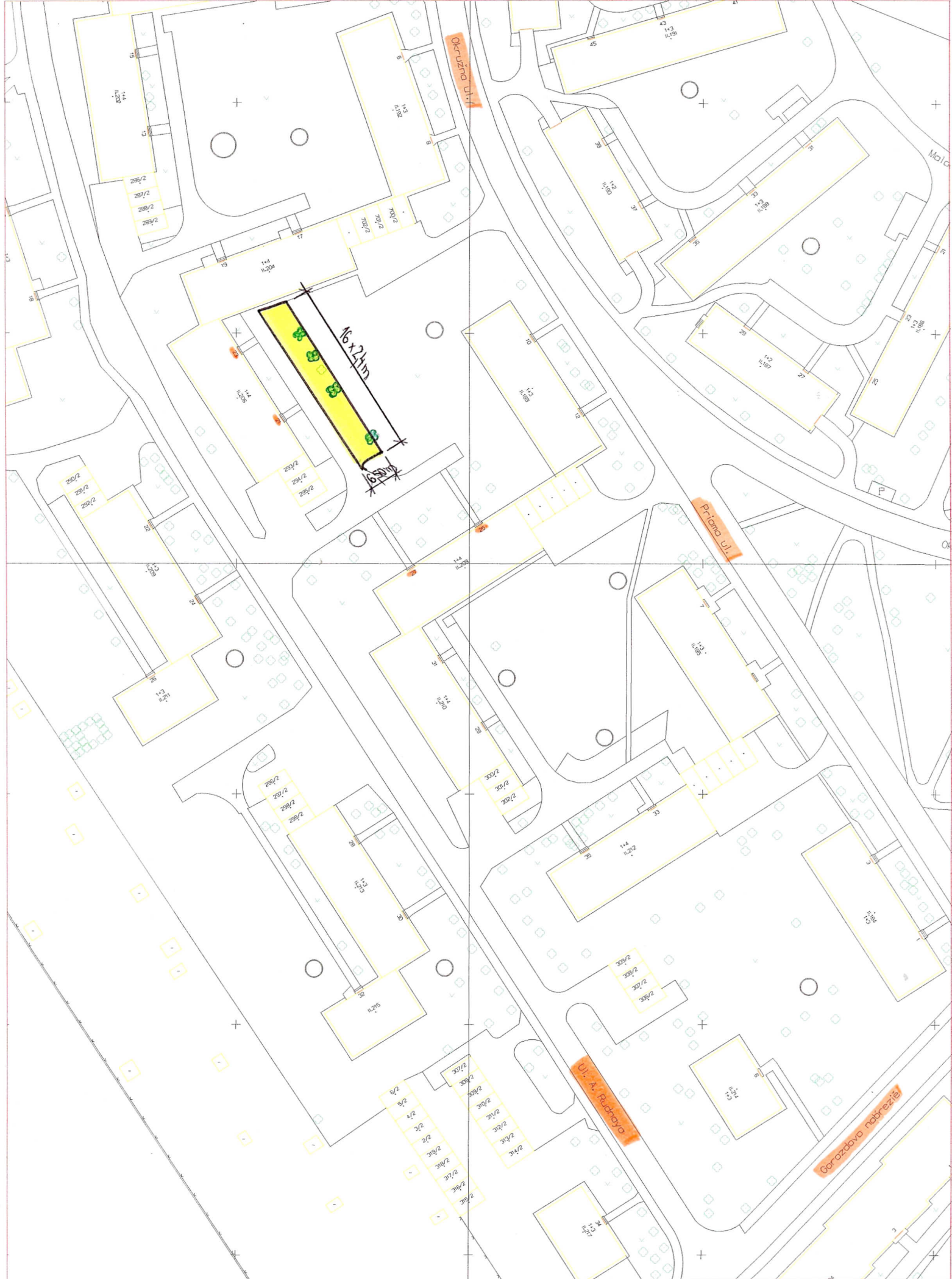
9.4.2014, Spevnená plocha Ulica A. Rudnaya - náčres stavby, M 1:1000