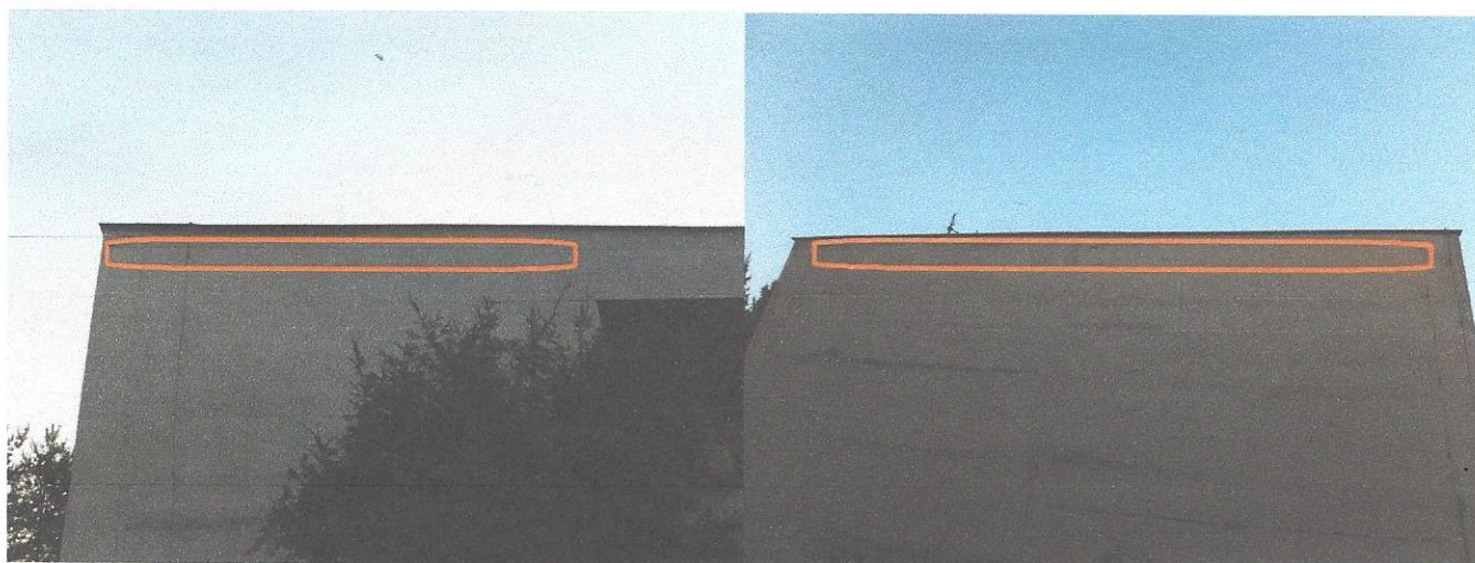
Vľavo foto č. 6 Miesto vhodné na inštaláciu búdok (APUS 3) na SV fasáde budovy A Vpravo foto č. 7 Miesto vhodné na inštaláciu búdok (MAXI B) na JZ fasáde budovy B