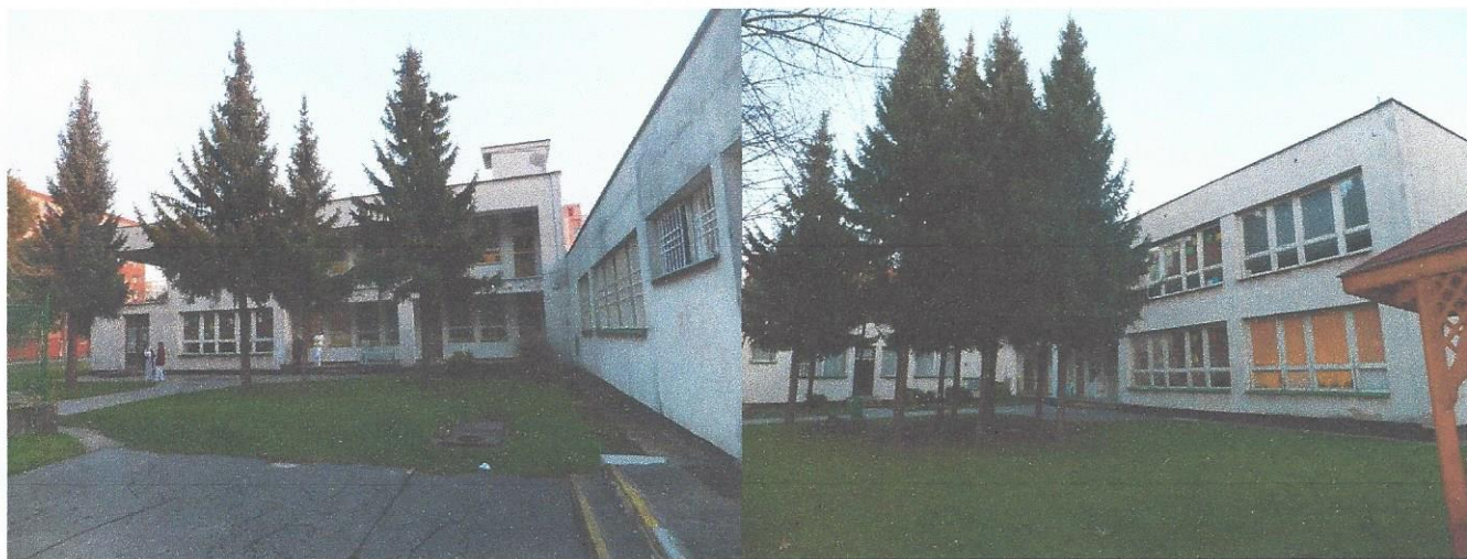
Foto č. 1 Celkový pohľad na riešené objekty

Komplex budov tvoria dve dvojpodlažné budovy A a B a jeden hospodársky pavilón (HP), ktorý je jednopodlažný. Budovy majú pórobetónový obvodový plášť s plochou strechou. Budovy A a B majú horizontálne atikové otvory (na 2 stranách každej budovy po 4 ks, v celkovom počte 16 ks), ktoré sú všetky uzatvorené mriežkami a sieťkami. (Foto č. 1).