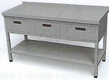
položka č. 1

MESTO ŽILINA - ŽILINA 4-769 4-769/2021 12.2.21