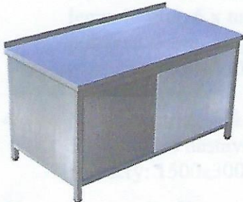
položka č. 5